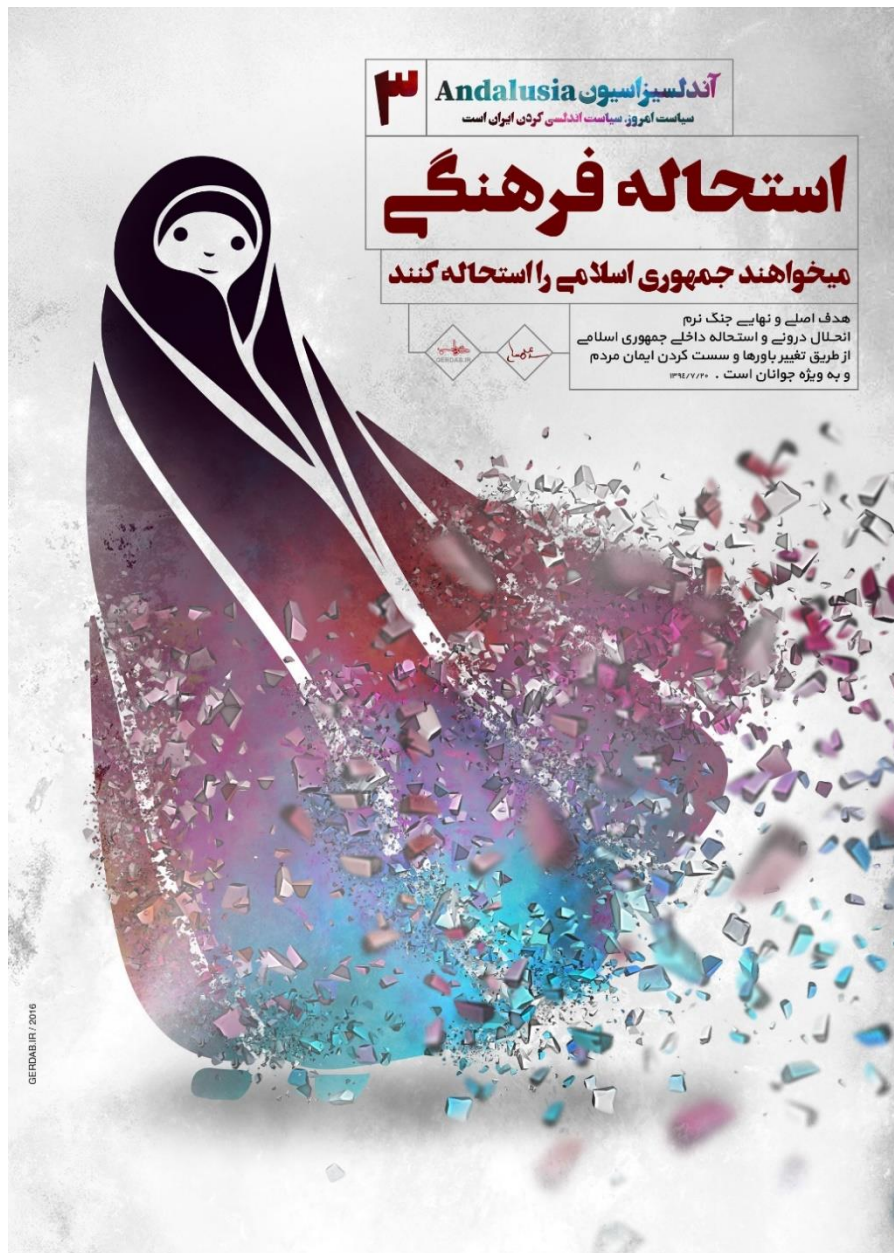
در این تصویر نمونه یک پوستر را مشاهده می‌فرمایید.

پوستر یا دیوارکوب که به آن اعلان نیز می‌گویند طرحی گرافیکی در یک صفحه است که برای ارائه محتوا در یک نگاه به مخاطبان استفاده می‌شود صفحات کاغذی که عمدتاً ابعاد آنها A4 A3 یا ۵۰ در ۷۰ و ۱۰۰ در ۷۰ سانتیمتر است هر چند در ابعاد دیگری هم بسته به نوع کار طراحی می‌شوند که بر روی آنها نوشته‌ها طرح‌ها یا نقاشی‌ها چاپ شده است.