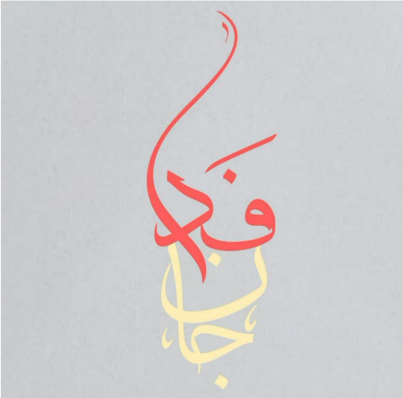
لگوی جان فدا